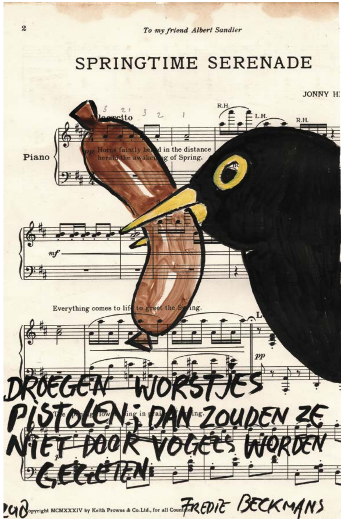
(Penseeltekening Fredie Beckmans, zie ook pagina 34 en 35)

Hierna volgen meer praktische vragen over de bereiding van maaltijden in de PI's: